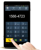
보는통화 등록기관에 전화