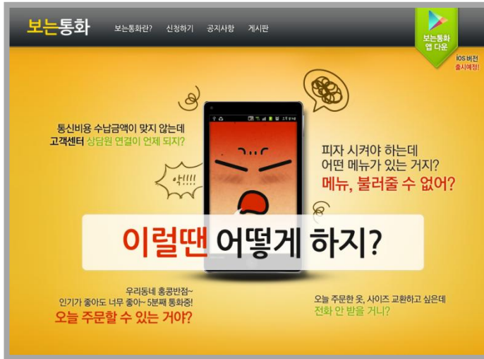
① 보는통화 웹사이트 접속 www.보는통화.com