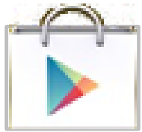
스마트폰에서 Play스토어 실행