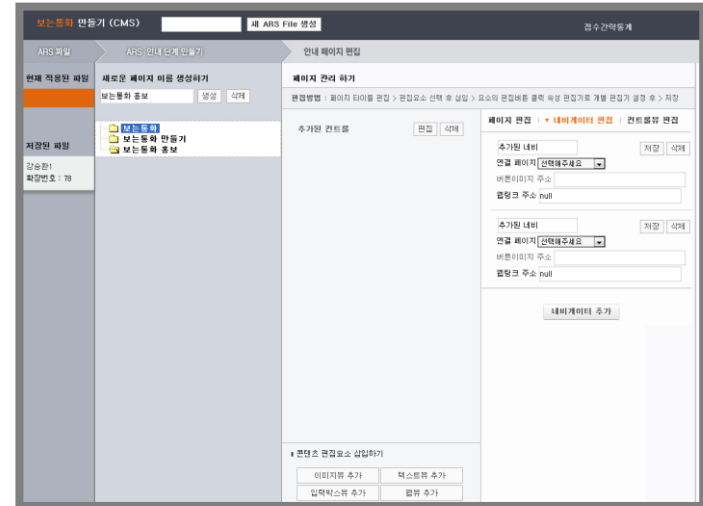
④ 관리자모드에서 우리 단체만의 멋진 안내앱 또는 포털앱을 만드세요.