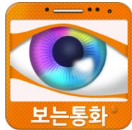
보는통화로 검색 후 앱 설치