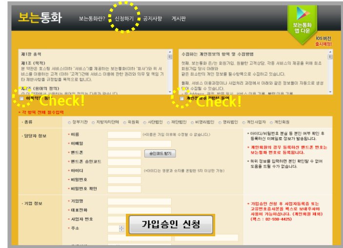
② 신청하기 버튼 클릭 > 내용기입 > 가입신청 승인 버튼 클릭 ※가입승인이 되면 등록을 요청하신 번호가 등록됩니다.