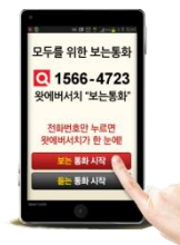
등록기관 전용 안내페이지로 연결